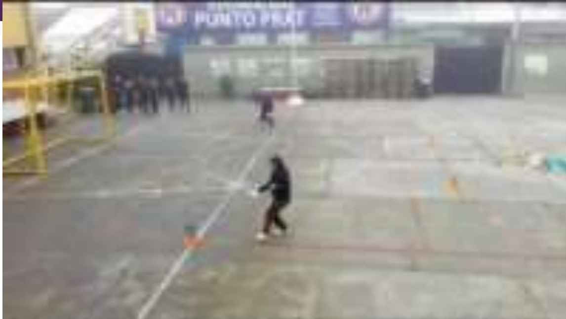
JUEGOS CON LENTEJAS Y CONOS