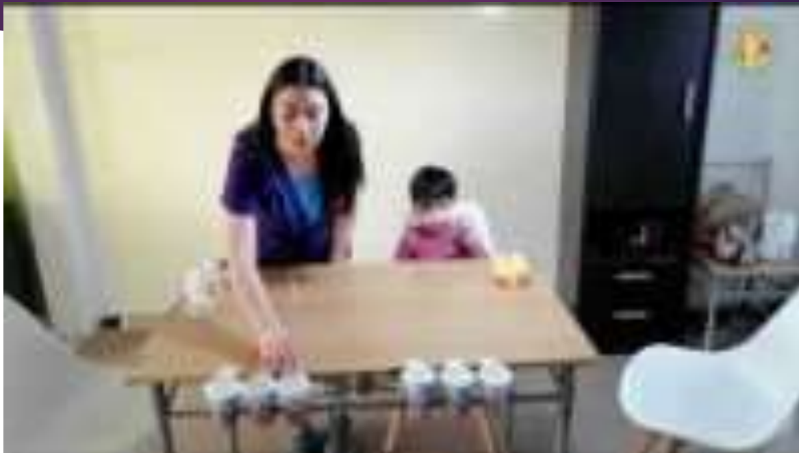
JUEGOS CON PELOTAS DE PING – PONG